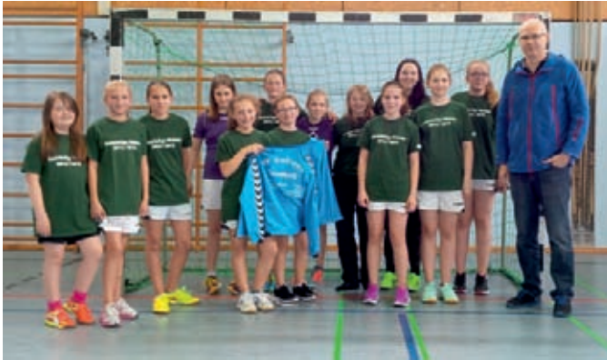
Weibliche Handball D-Jugend Meister der Bezirksliga Oberfranken-Ost

Duathlon Triathlon Gymnastik Handball Karate Kegeln Laufen Schwimmen Seniorenturnen Skisport Spielmannszug Steppaerobic Tischtennis Trampolin Turnen Volleyball