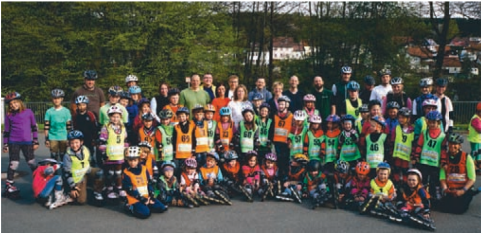
Auf dem Gefreeser Festplatz stellten sich die Teilnehmer mit den Trainern und Helfern des Inlinekurses dem Fotografen