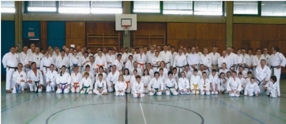
Zum Abschluss versammelten sich die Teilnehmer zu einem Erinnerungsfoto

Am Samstag, den 28. März veranstaltete die Karateabteilung des TV Gefrees wieder ihren alljährlichen Frühlingslehrgang, zu dem mehr als 100 Karatekas den Weg in die Schulturnhalle gefunden hatten.