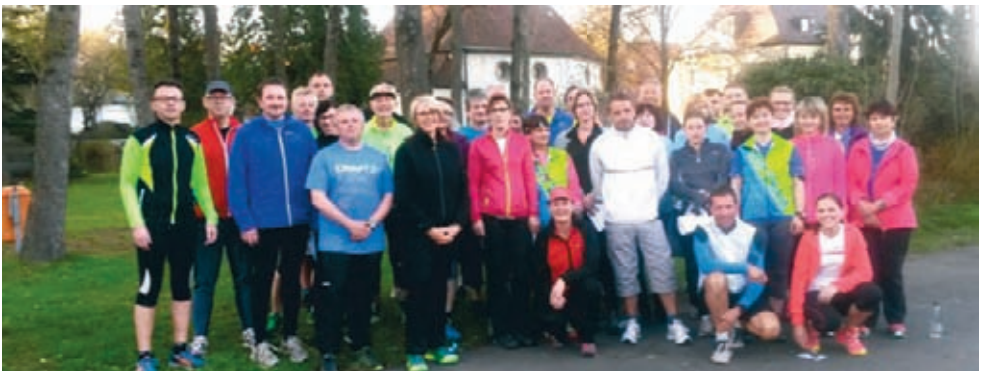
Gruppenfoto beim Start der Projekts „Lauf 10/Lauf 21“ am Stadtpark in Gefrees

Zum ersten Training stellten sich der Herausforderung 31 motivierte Läuferinnen und Läufer, die von sechs Trainern begrüßt und betreut wurden.