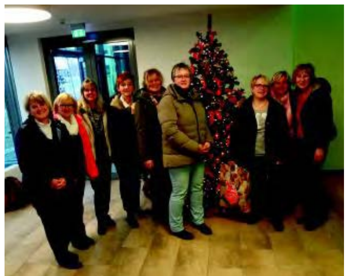
Besuch bei Lebkuchen-Schmidt und Stadtrundfahrt in Nürnberg mit Vorweihnachts-Shopping am 12. November

*) Das Training findet, wegen der Reparaturarbeiten in der Schulsporthalle, bis auf Weiteres in der Stadthalle statt, jeweils montags ab 19:30 Uhr Bauch, Beine, Po-Gymnastik (Gr. Konferenzraum)