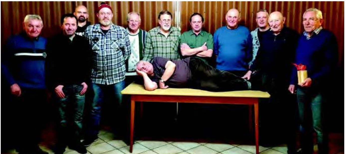
Die Protagonisten mit ihrem „Kugela Buff“ König.