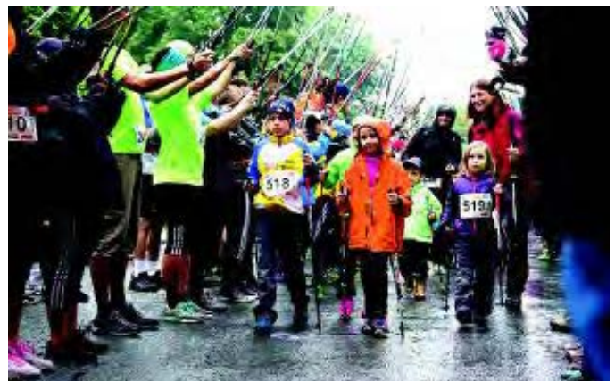
Die Starts zum 13. Nordic Walking Marathon. Sowohl die Kids, als auch die Erwachsenen gingen bei leichtem Regen auf die Strecke. Der tat dem Spaß an der Sache jedoch keinen Abbruch.

einige Mädchen und Jungen aus Kindergärten in Angriff nahmen. Für sie gab es keine Zeitmessung, doch wettbewerbsorientierte Läufer konnten in der Trendsportart Trail Running um Bestzeiten kämpfen. Die Route war in diesem Jahr leicht verändert. Auf den steilen Teil beim Luitpolddenkmal haben wir diesmal verzichtet. Insgesamt hatten wir 100 Helfern, die für einen reibungslosen Ablauf des Tages sorgten. Allen Helfern auch hier ein besonderer Dank!