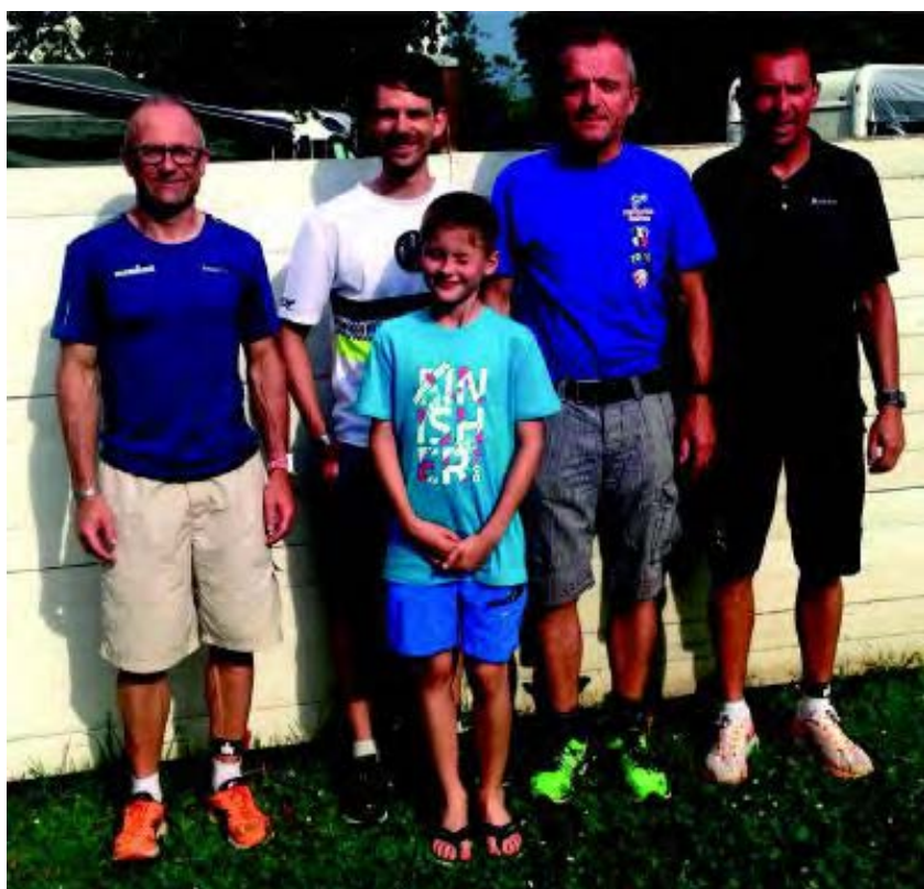
Unser Ma-Tri-Du Team in Klagenfurt